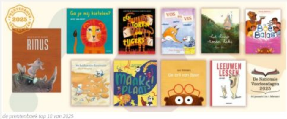
de prentenboek top 10 van 2025